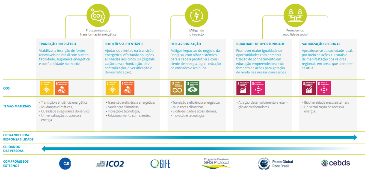
Figura 3 - ODS prioritárias da ENERGISA

A Figura 3 apresenta as ODS prioritárias da ENERGISA .