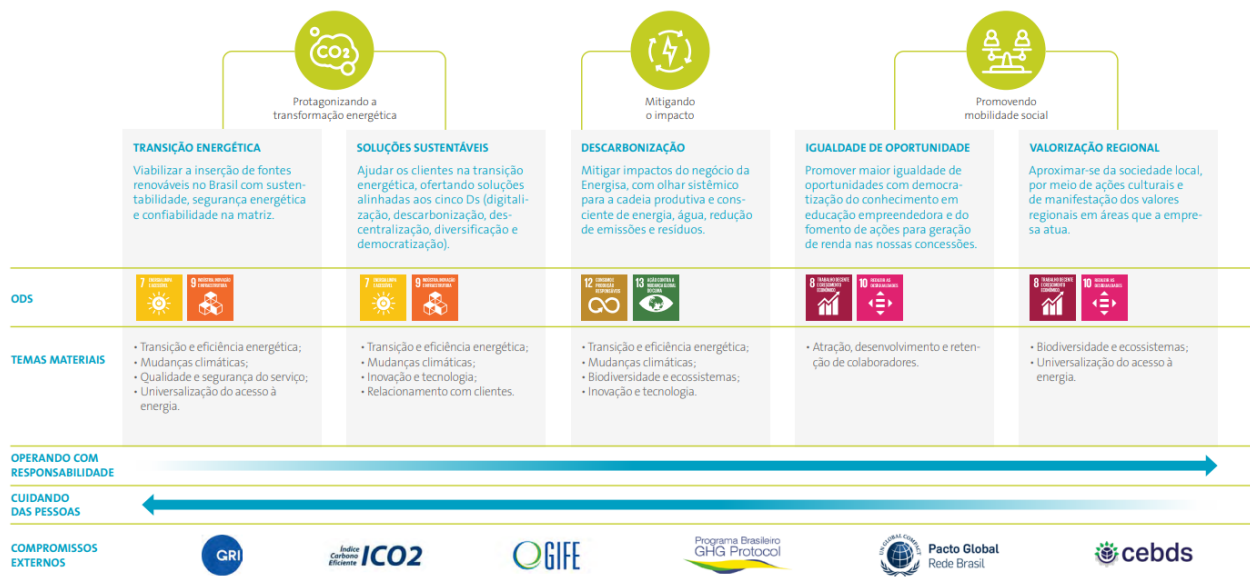
Figura 3 – ODS prioritárias da ENERGISA

A Figura 3 apresenta as ODS prioritárias da ENERGISA .