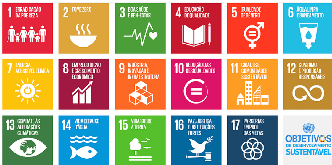
Figura 2 – Objetivos de Desenvolvimento Sustentável da ONU

Em virtude do alinhamento e dos direcionadores ASG (Ambiental, Social e Governança), a ENERGISA definiu as ODS prioritárias, sendo: ODS 7 – Energia limpa e sustentável; ODS 8 – Trabalho decente e crescimento econômico; ODS 9 – Indústria, Inovação e Infraestrutura; ODS 10 – Reduzir as desigualdades; ODS 12 – Consumo e produção responsáveis; ODS 13 – Ação contra a mudança global do clima.